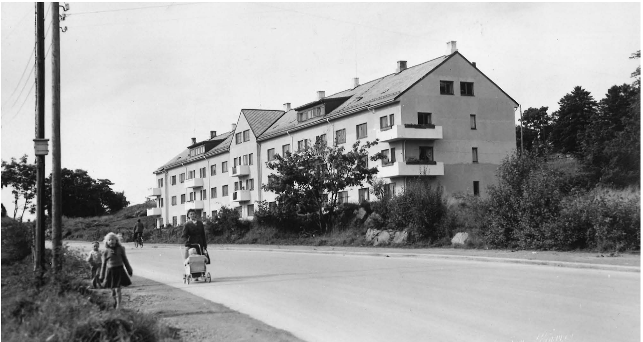
1949: Borgundveien borettslag i Ålesund var et av Ålesund boligbyggelags aller første prosjekter.