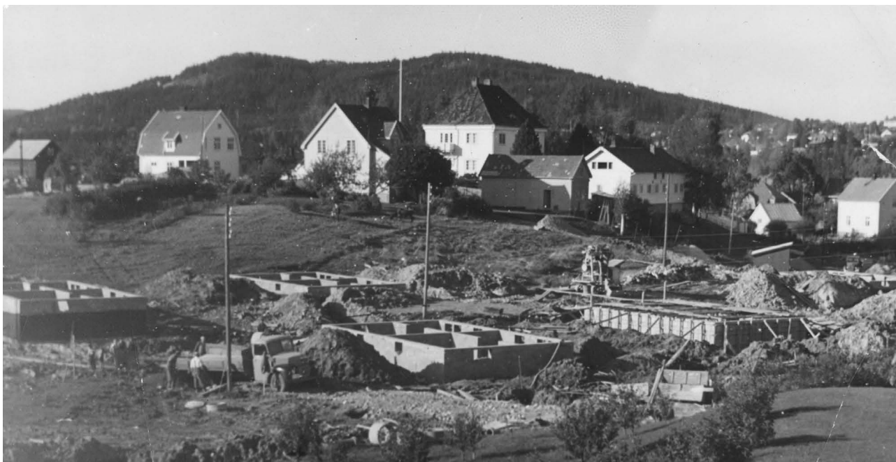
Ett av de første borettslagene i Kongsvinger var Jernbanens borettslag i Prinsens gate.

På fagforeningshold tas det initiativer for å opprette kooperative produksjonslag for bygge- og anleggsvirksomhet, samt tilvirkning av byggematerialer. Tanken er at dette skal skje i et nært samarbeid med boligsamvirket og NBBL. Selskapet Dugnad blir etablert som en landsdekkende paraply for virksomheten, der også NBBL er med i stiftelsesprosessen.