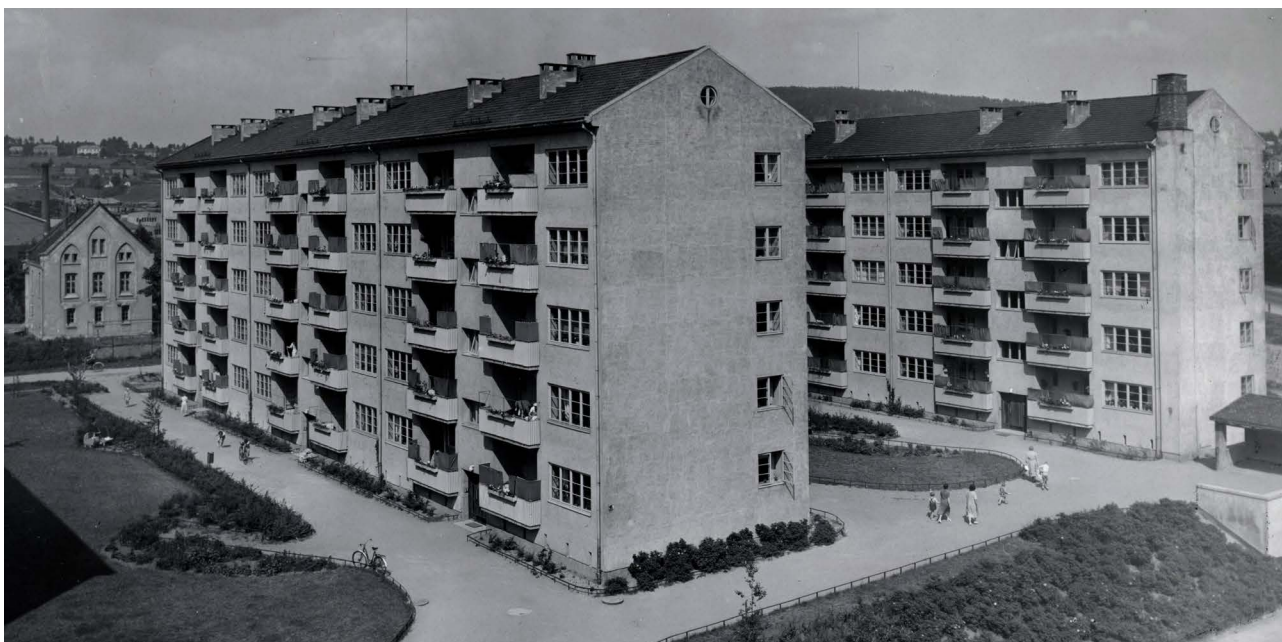
Brochmannsgate borettslag ligger på Bjølsen i Oslo og sto ferdig i 1947. Det består av to blokker med til sammen 60 leiligheter, alle på fire rom og kjøkken. Arkitekter: Arne Pedersen og Reidar Lund.

I løpet av året stiftes det hele 80 boligbyggelag i Norge, og 55 av disse blir formelt medlem av NBBL. Mange av lagene som starter opp i de første årene etter krigen er avhengig å få hjelp, både fra lokalt hold (kommunen) og sentralt hold (NBBL). Fra kommunen må lagene støttes gjennom tomteervert og byggetillatelse, men til dels også direkte støtte til driften av laget. Det er derfor helt avgjørende for lagene å komme i god dialog med kommunen, og dette får de hjelp til fra NBBL. Dette kommer i tillegg til hjelp til selve den formelle etableringen av laget og etter hvert til planlegging og utvikling av boligprosjekter. Også her hjalp NBBL til med dialogen med lokale myndigheter. Mange lag har så som så med ansatte og mye er basert på frivillig innsats og dugnadsaktivitet. Ikke rent få lag får derfor en forholdsvis kort levetid.