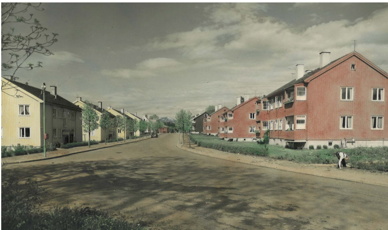
Fannebo: MOBOS (tidl. Molde Boligbyggelag) aller første borettslag i firemannsboliger med til sammen 44 leiligheter. De første leilighetene ble innflyttet rett før jul i 1948.

De første 3–4 årene av NBBLs historie preges av stor aktivitet rundt stifting av nye boligbyggelag landet rundt, men også av organisatorisk konflikt og dramatik. Særlig mellom OBOS og NBBL foreligger det gnisninger med røtter tilbake til 1930-tallet. I NBBLs administrasjon – der mange er rekruttert inn fra leieboerbevegelsen – er man kritisk til OBOS sin sterke kobling til Oslo kommune og dennes store innflytelse over så vel bygging som tildeling av de fleste boliger som OBOS ferdigstiller. Dette går ut over medlemsinnflytelse og «ekte boligkooperativt selvstyre og kontroll» mener noen, ikke minst i NBBL.