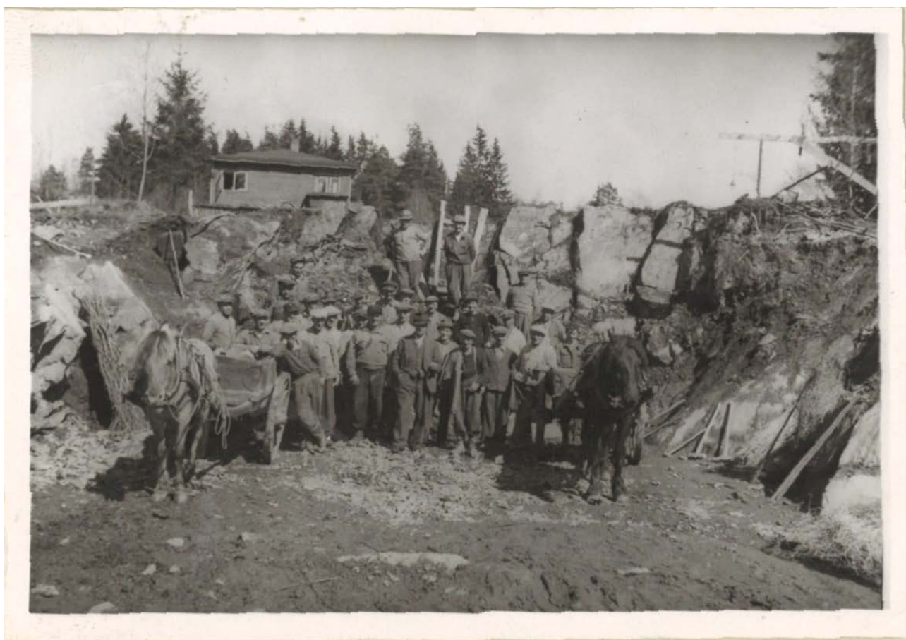
Her startet Kongsvinger Boligbyggelag (KOBBL) med byggingen av fire etasjes boligblokk i Storgata 9 i 1946. Bildet viser arbeidslaget på tomte etter at det ble sprengt med dynamitt.

Dette året var det også fødselsboom: Nesten 71 000 fødsler i løpet av ett år, noe som fortsatt er rekord i norsk etterkrigstid. Barnetrygd blir også innført i løpet av året.